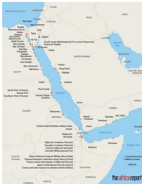
Figuur 2: Commerciële havens en militaire basissen in de Rode Zee 3

Iran, voorstander van het concept ‘strategische diepte’ – d.i. de problemen zo ver mogelijk weghouden van het eigen grondgebied – destabiliseert de volledige regio via proxies . Irans invloed reikt tot Bab el-Mandeb, waar de Houthi-rebellen succesvol het maritieme handelsverkeer aanvallen en saboteren. Maersk kondigde op 10 juli 2024 aan alle transit door de Rode Zee te stoppen en de langere route rond Kaap de Goede Hoop te nemen. De aanval van de Houthi’s op de Griekse olietanker Sounion in augustus 2024 met potentieel grote gevolgen voor het milieu demonstreert de dominantie van Iran en de Houthi’s op de zuidelijke toegang tot de Rode Zee, ondanks grote militaire aanwezigheid in Djibouti (figuur 2).